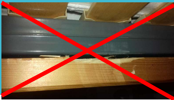
Etat d'un lit laissé au Gîte des Mésanges